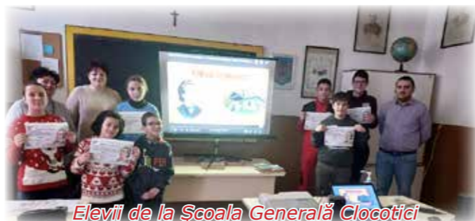
Elevii de la Școala Generală Clocotici