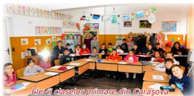
Elevii claselor primare din Carașova