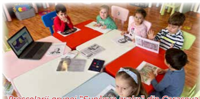
Preșcolarii grupei "Sunceve zrake" din Carașova