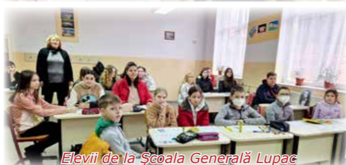
Elevii de la Școala Generală Lupac