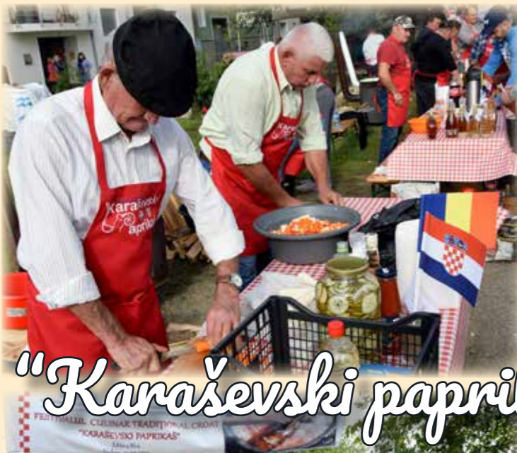
"Karaševski paprikaš" - Vodnik 2022.