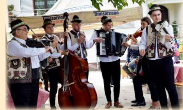
Traka u Jabalču 2022.