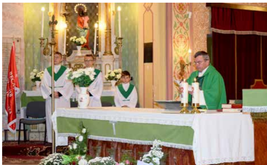
Sveta misa u Rekašu

svoju inicijativu obuhvatio sve zborove iz susjednih zemalja. Ja se osjećam jako dobro ovdje, i koliko god rekaški svećenik ne zna hrvatski, svi znamo kad treba upasti, kad svećenik prestane, kad mi trebamo nastaviti. Eto, to je ono što mene jako veseli, a i cijeli moj zbor, zacijelo”.