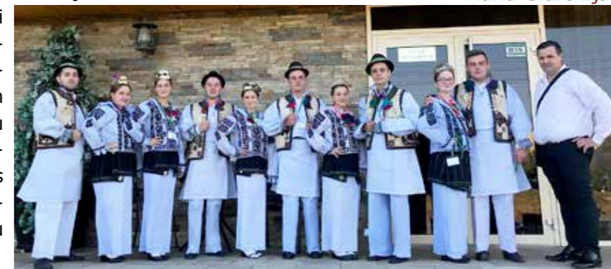
Karaševska zora u Iașu