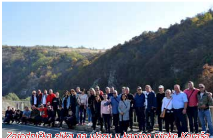
Zajednička slika na ulazu u kanjon rijeke Karaša

Viteška igra Ples od boja izvedena je na karaševskoj pozornici u vrlo atraktivnoj narodnoj nošnji, igra je bila živa, temperamentna, a jedan od protagonista, ratnik, izvodio je smione i sigurne pokrete mačem. Ples od boja bio je praćen dijalozima, svirkom, prikazao je borbu između neprijatelja i domaće vojske predvođene kapitanom, a posebno je slikovito bilo i izvijanje do tri metra