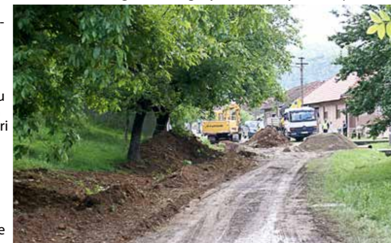
Iskopavanje je već započelo u donjem kraju sela

dine započeli su prvi iskopi za realizaciju najveće investicije u povijesti našega mjesta, veće od one za izradu šumskih puteva Mogila i Uljanica iz 2011. g. ili od ulaganja za uvođenje