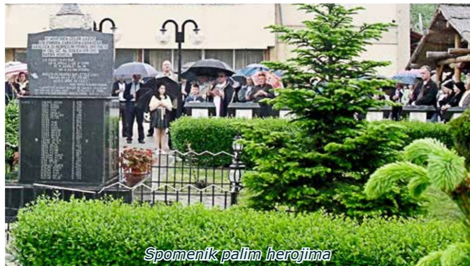
Spomenik palim herojima

Na granitnim pločama spomenika iz Karaševa upisana su imena stradalih ili nestalih boraca iz karaševske općine u prvom i drugom svjetskom ratu i uklesani su stihovi prof. Milje Radana „U boj su pošli“, u znak sjećanja na one koji su svojom žrtvom zavrijedili da im ime ostane u vječnom pamćenju. 62 boraca iz općine Karaševo izgubilo