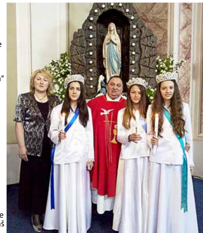
Marijanske koje su zafalile

njihov doprinos zajednici se sastoji u očuvanju i promoviranju ove jedinstvene tradicije u našim karaševskim selima.