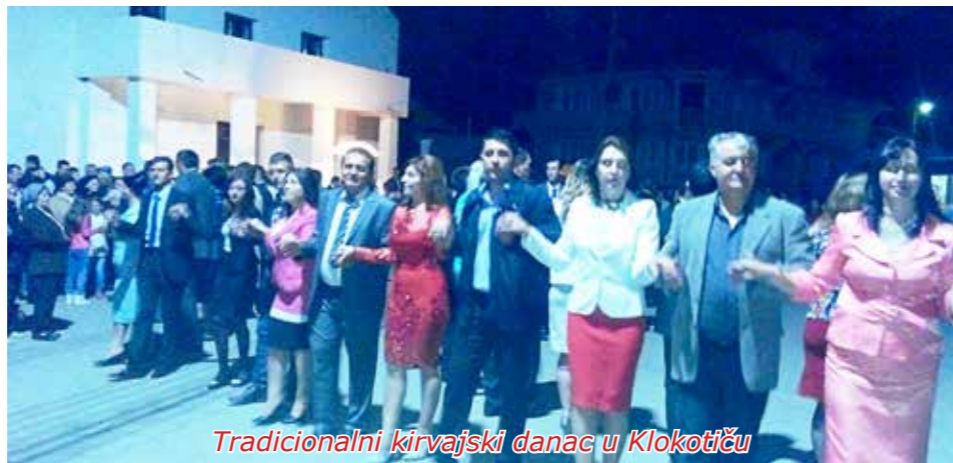
Tradicionalni kirvajski danac u Klokotiču