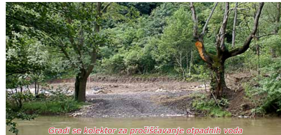
Gradi se kolektor za pročišćavanje otpadnih voda

vodovoda u Karaševu i Jabalču iz 2012. godine. Bageri iskopavaju na trima lokacijama, a na izlasku iz sela prema Karaševu, na lijevoj strani rijeke Karaš, u tijeku su radovi za