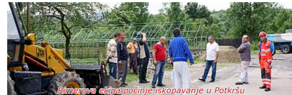
Rimerova ekipa počinje iskopavanje u Potkršu

dine započeli su prvi iskopi za realizaciju najveće investicije u povijesti našega mjesta, veće od one za izradu šumskih puteva Mogila i Uljanica iz 2011. g. ili od ulaganja za uvođenje