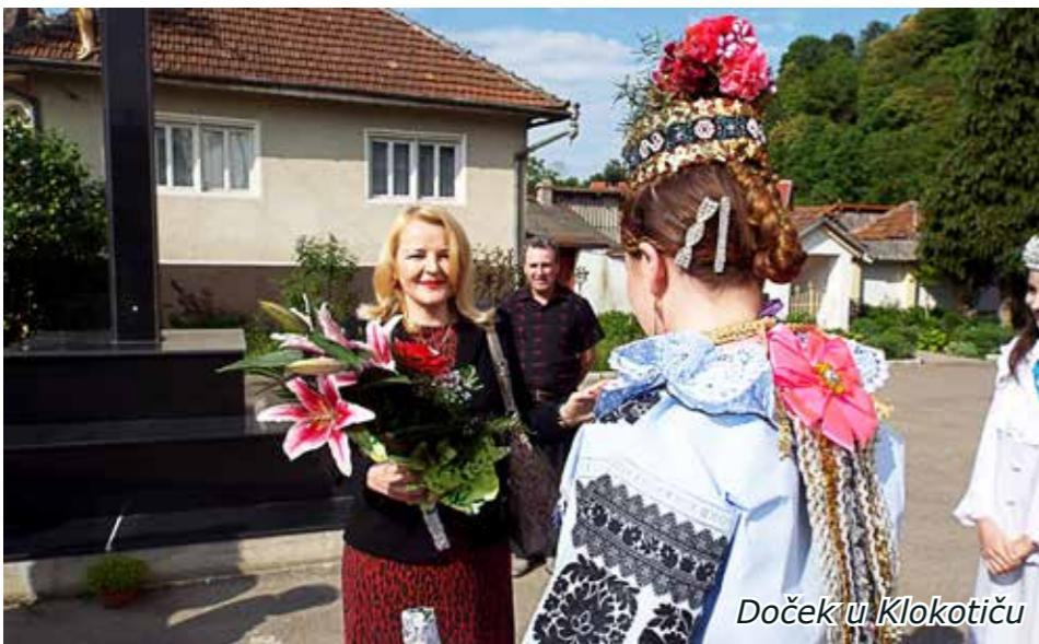
Doček u Klokotiču