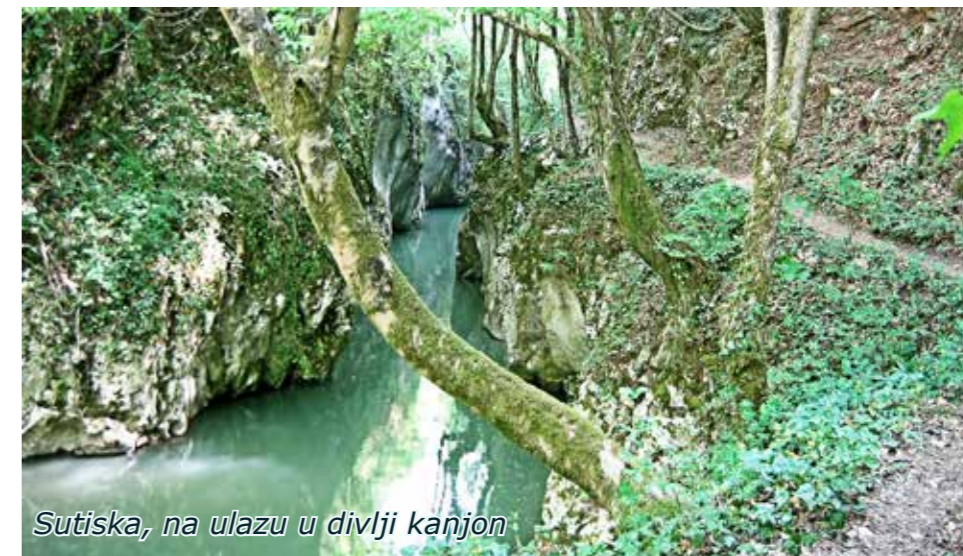
Sutiska, na ulazu u divlji kanjon