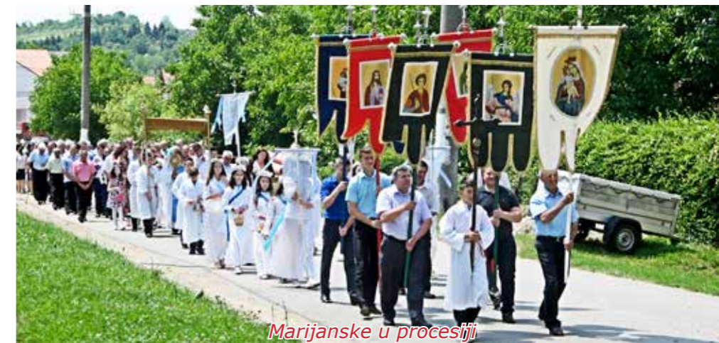
Marijanske u procesiji

Postati „Marjanskom“ nije teško. Uvjet koji se mora ispuniti je taj da moraš najprije dobiti Prvu sv. Pričest. Odmah nakon toga, možeš postati „Marjanskom“. Danas „Marjanske“ su učenice od II. razreda pa sve do VIII. razreda OŠ. „Marjanske koje su zafalile“, to su učenice koje završavaju VIII raz-