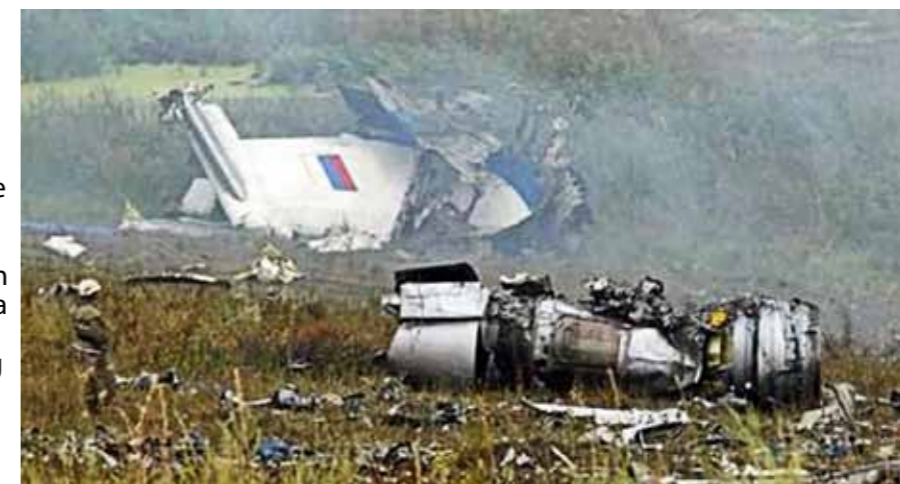
Srušeni zrakoplov na ukrajinskom području

Zbog ukrajinske krize bitno su narušeni odnosi Zapada s Rusijom pa se novonastala situacija često povezuje s novim Hladnim ratom. Velika je nesreća bila pad zrakoplova na letu MH17 Malaysia Airlinesa iz Amsterdama za Peking, kada je smrtno stradalo 298 putnika i članova posade. Iako istraga još traje, odgovornost za rušenje zrakoplova nitko nije preuzeo,