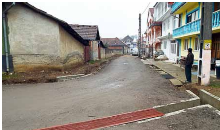
Započela je obnova klokotičkog "Ciganskog sokaka"

Planirate li tu obnovu dovršiti ove godine ili je to, ipak, višegodišnji plan?