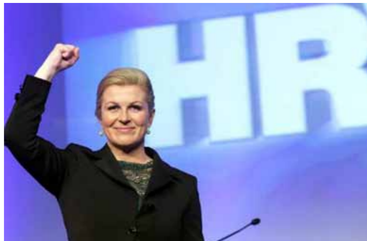
Kolinda Grabar Kitarović - Predsjednica Hrvatske

"Dozvolite da čestitam na pobjedi novoizabranog predsjednici Kolindi Grabar Kitarović. Imali smo napornu kampanju, sučeljavanja i međusobno oponiranje, no demokracija je pobijedila. Gospođa Grabar Kitarović je pobijedila u demokratskoj utakmici i zato čestitam. Istina, razlika je jako mala, no to je bit