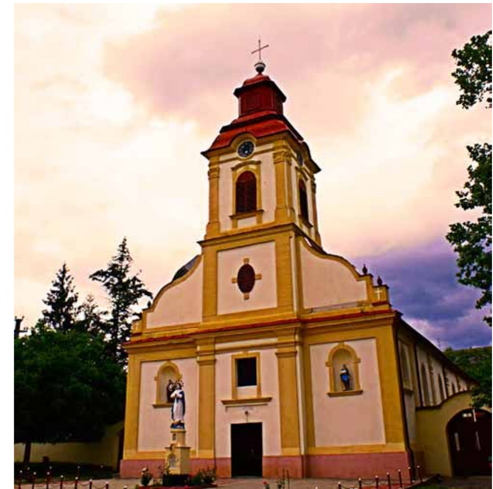
Crkva Marijina Uznesenja u Karaševu