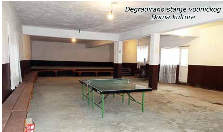
Degradirano stanje vodničkog Doma kulture

U Vodniku imamo dva sokaka koji bismo ove godine htjeli da obnovimo. Želimo da nastavimo otuda gdje smo stali s asfaltiranjem – od crkve prema gornjem kraju sela, a drugi sokak koji imamo u vidu jest "U Reše", kako se tamo kaže. To je sveukupno