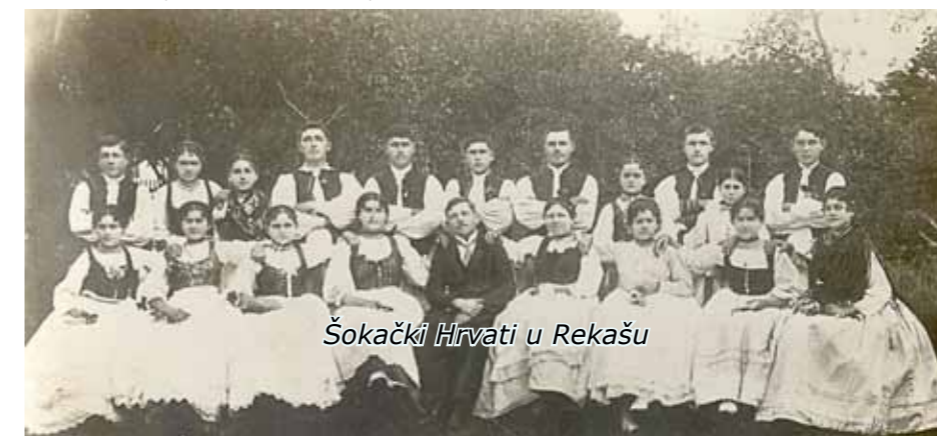
Šokački Hrvati u Rekašu